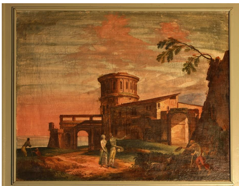
SOVRAPORTA VILLA MORANDO – Sala delle Arti